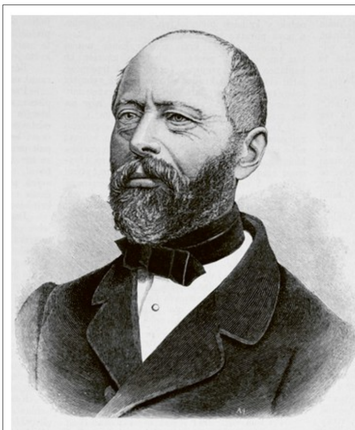
Portrét Vincence Mastného (1809–1873), českého podnikatele a politika.

Starosta a továrník Vincenc Mastný stál v roce 1861 u zrodu lomnické záložny, byl jejím prvním předsedou a záložna zprvu sídlila v jeho domě na náměstí. Finančně pomáhal a staral se o zřízení místních měšťanských škol i průmyslové školy