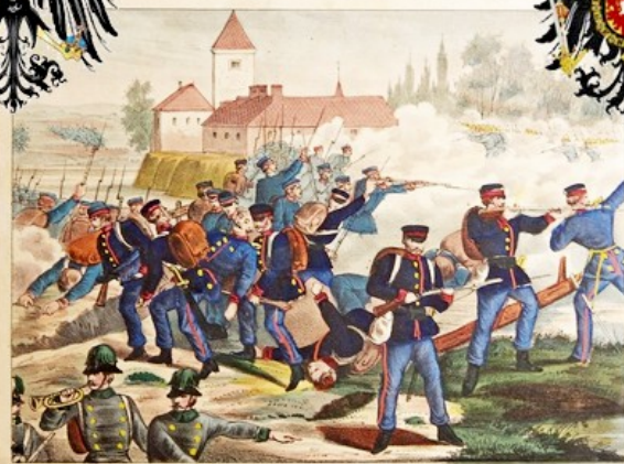
Die Sachsen im Gefecht bei Bilschin