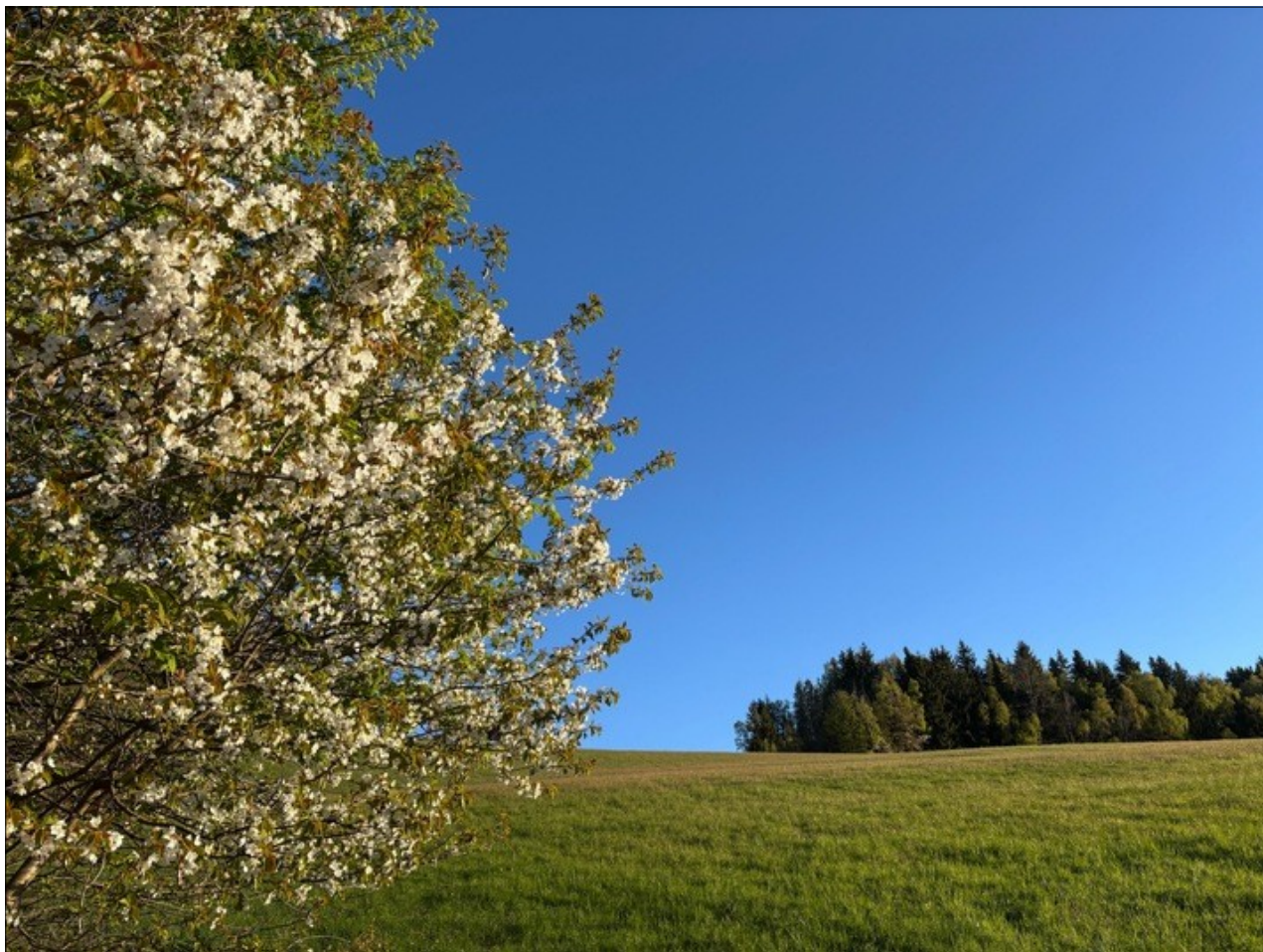
Z výletu na Hamštejnský hřeben