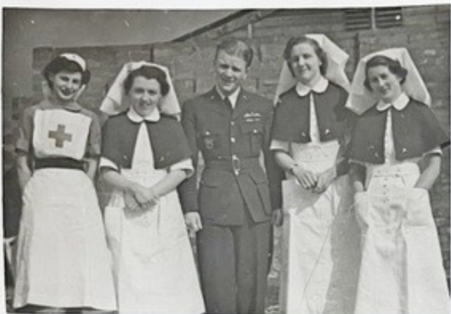
červen - 41 - RAF nemocnice Wilmslow.