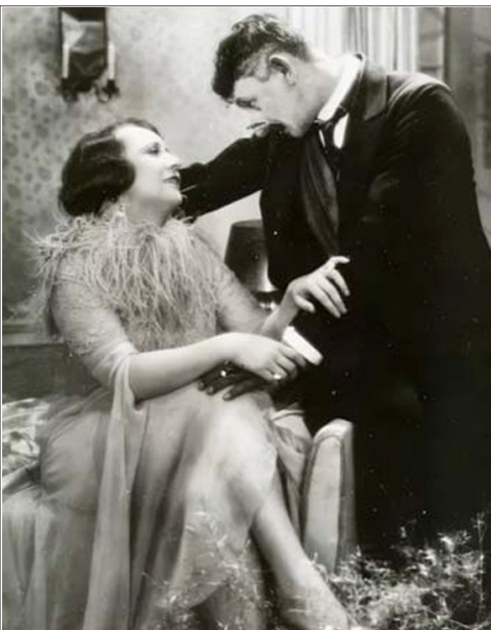
Valentová s Vlastou Burianem ve filmu To neznáte Hadimršku