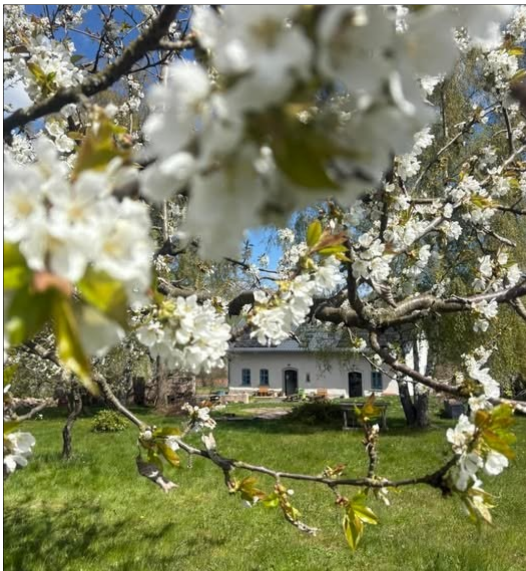
Jarní motiv z Lomnicka