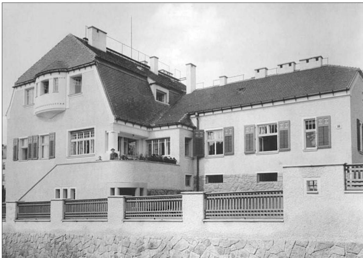
Dresslerova vila, dnes MŠ Jugoslávská