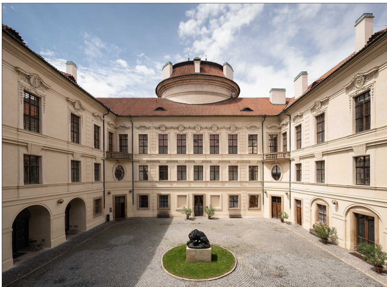
Schwarzenberský palác

Ve třech přízemních sálech Schwarzenberského paláce prezentuje Národní galerie Praha nyní přes čtyřicet děl, která vznikla v 17. a 18. století na území Čech. Například po padesáti letech mají návštěvníci možnost prohlédnout si