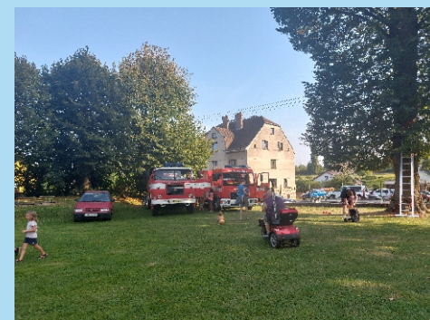
Ukázka techniky SDH Mladějov a lanová dráha pro děti.