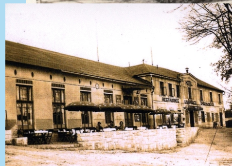
Hostinec u Vrabců