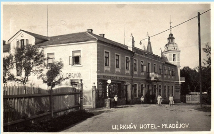
Hostinec u Ulrichů