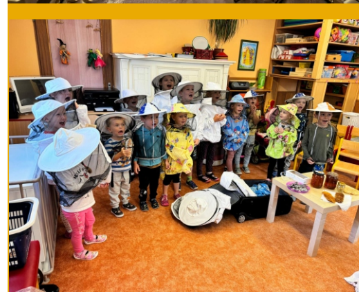
Akce: Včelky do školy a školky