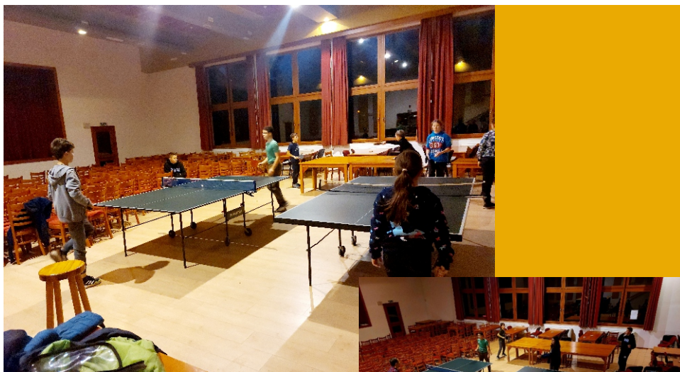
Děti trénují na turnaj