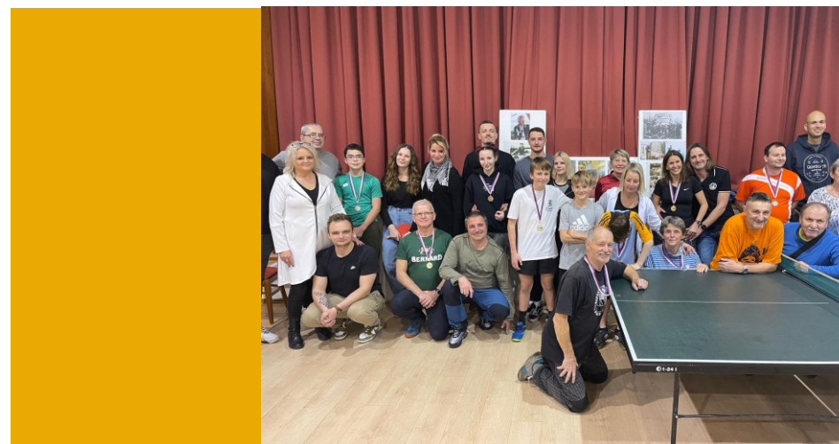
Vítězi kategorie děti