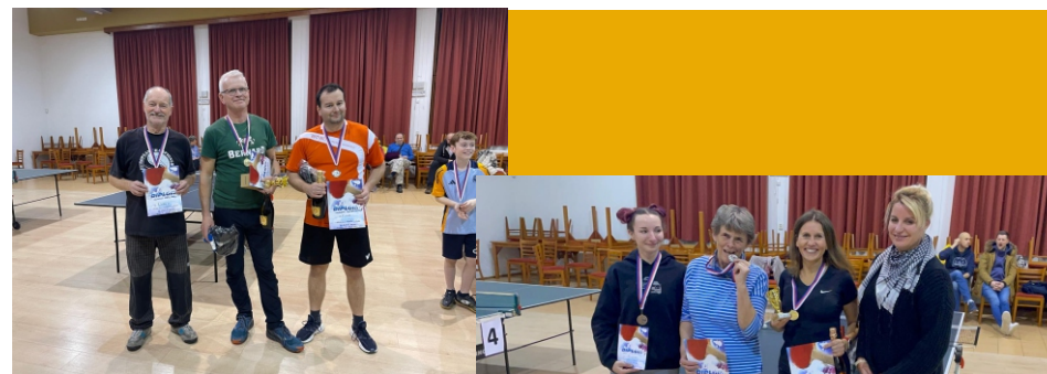
Vítězi kategorie muži