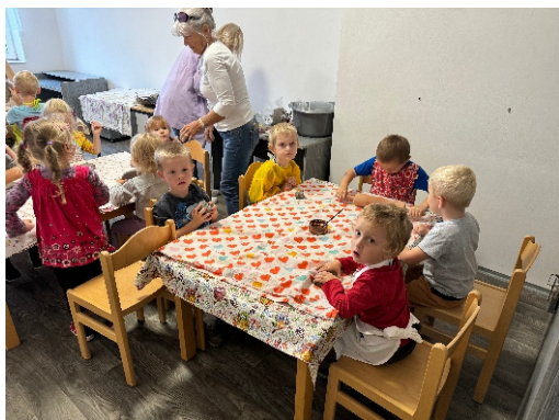
Návštěva MŠ Libošovice v mladějovské keramické dílně