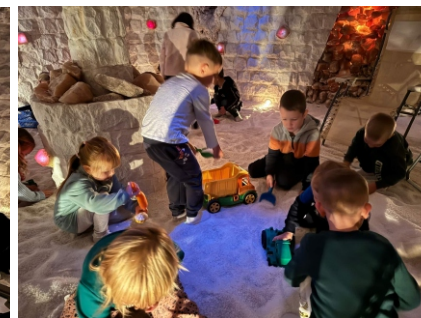
Solná jeskyně Jičín