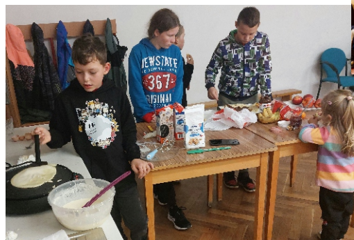
Malí hasiči se učí dovednost kuchaře