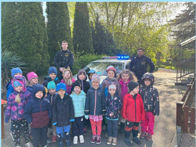
Návštěva Policie ČR v MŠ