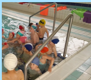
Plavecký výcvik v Aqua centrum Jičín