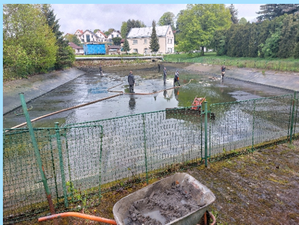
Jarní brigáda SDH Mladějov, čištění nádrže a sběr železa

SDH Mladějov děkuje občanům za spolupráci při sběru železa.