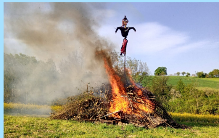
Pálení čarodějnice u hřiště TJ Sokola Mladějov.