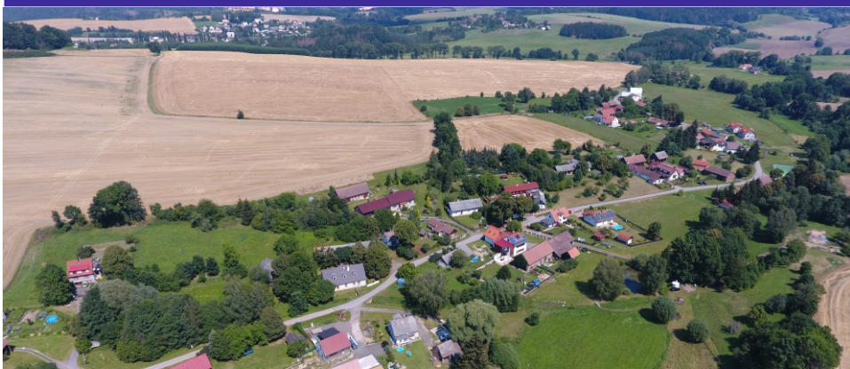
Letecký snímek Hubojed z roku 2020