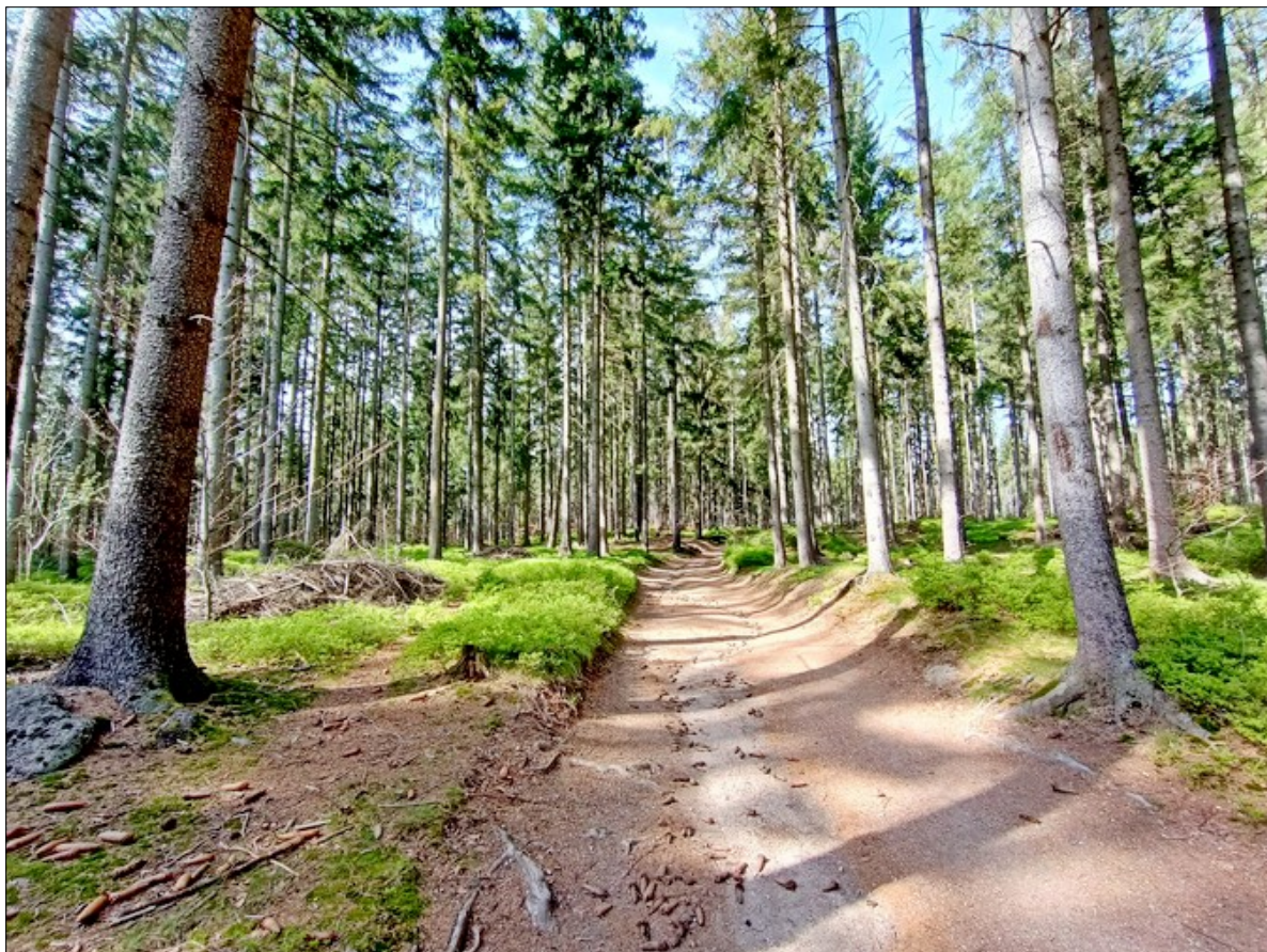
Motiv z jindřichovského lesa