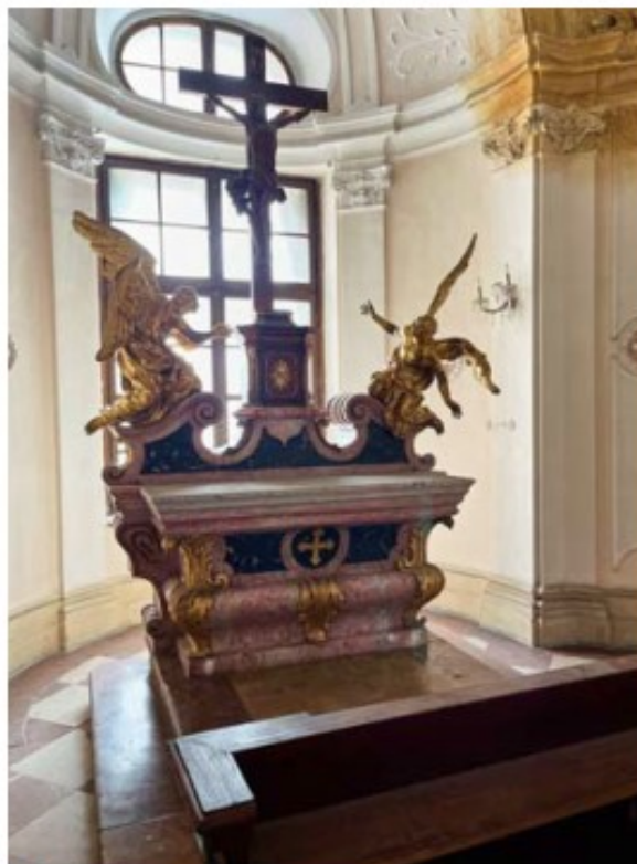
V zámecké kapli v Pruggu.