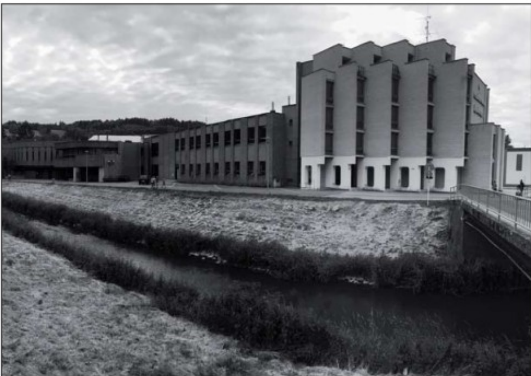
KC GOLF Semily v roce 2017, autor: Tomáš Jech.