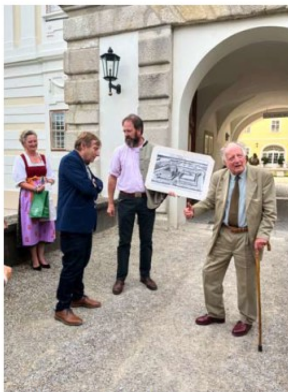
Přivítání na zámku Rohrau.