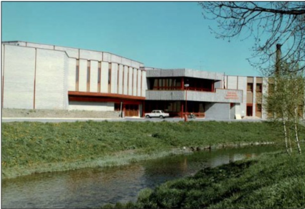
KC GOLF Semily v roce 1979.