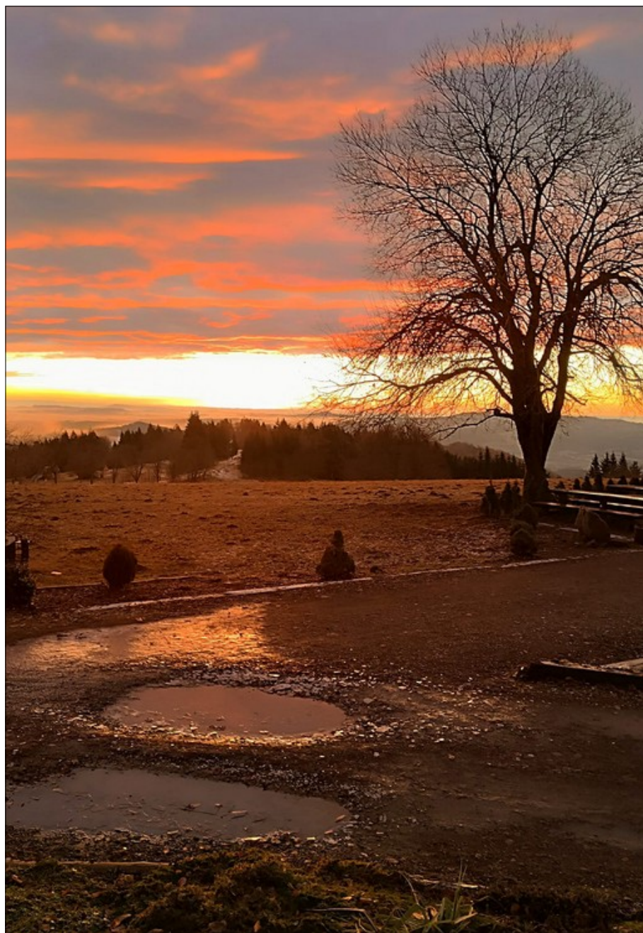
Motiv z Kozákova