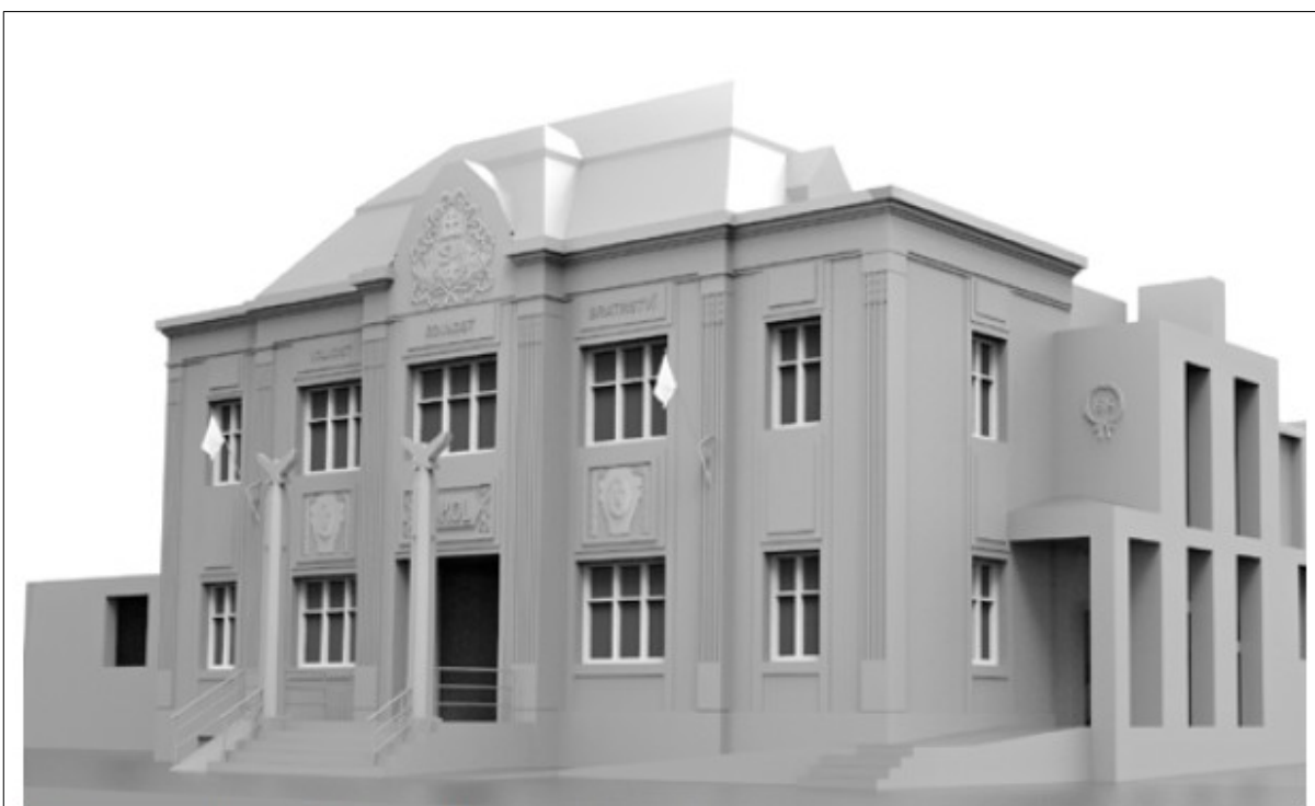
Podaři-li se sokolům získat finance, mohla by sokolovna za pár let vypadat takto.

V roce 2020, kdy probíhala výměna oken, se sokolové začali zaobírat myšlenkou vrátit sokolovně někdejší krásu. Nedařilo se však nalézt firmu, která by dokázala zpracovat projekt na základě archivních fotografií. Sokolové však věc vyřešili po svém, takříkajíc po sokolsku.