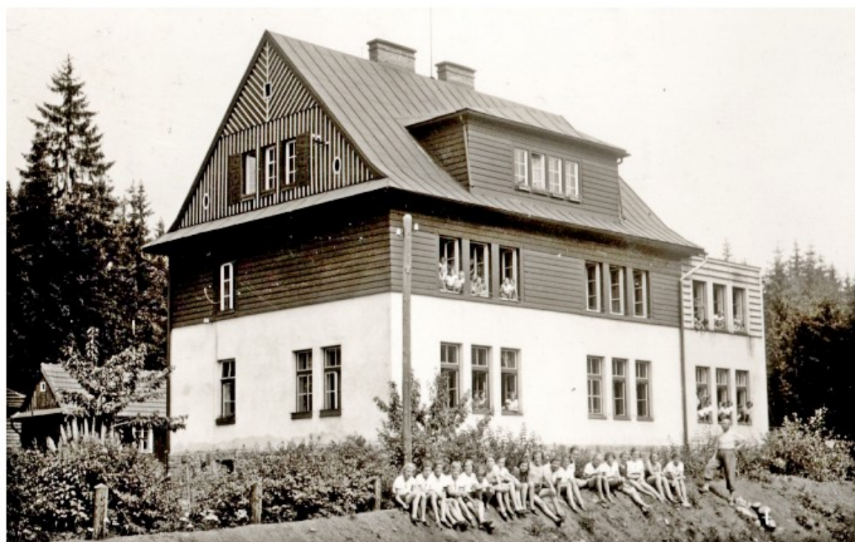
Masarykův dětský domov

Významným rokem je rok 1923. Pro kostel byly odlity tři nové zvony a 23. září do kostela slavnostně zavěšeny. V témže roce byl proveden státní zábor pohraničního území. Místní odbor Národní jednoty severočeské zakoupil při této příležitosti od ministerstva zemědělství pozemek pro Masarykův dětský domov (později ozdravovna, dnes městské byty pod Normou). Na zbytku pozemku vzniklo volejbalové hřiště.