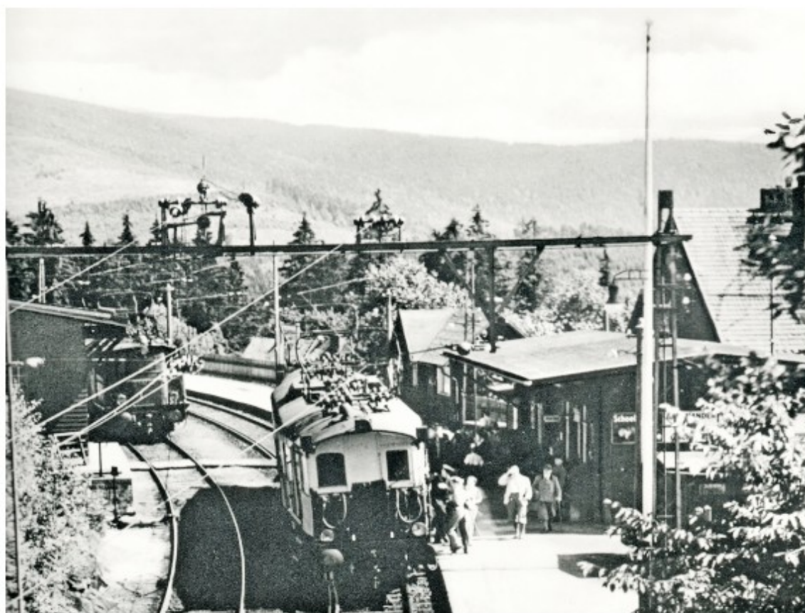
Příjezd ET89 Rübezahl na nádraží Strickerhäuser

V roce 1923 byla dokončena elektrifikace železnice na celém úseku Hirschberg-Polaun (Jelenia Gora - Kořenov), tedy i nádraží Strickerhäuser (Mýtiny). Od roku 1926 byl na trati nasazen slavný elektrický vůz ET89 Rübezahl (Krakonoš), který zde jezdil až do konce druhé světové války.