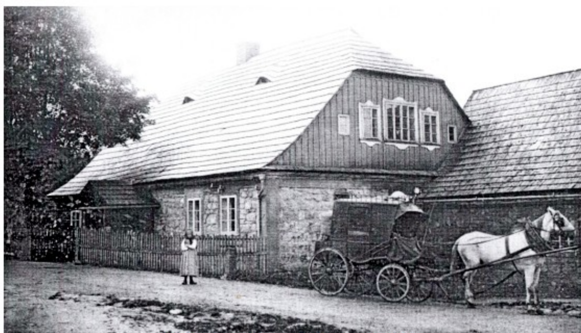
První pošta no Novém Světě