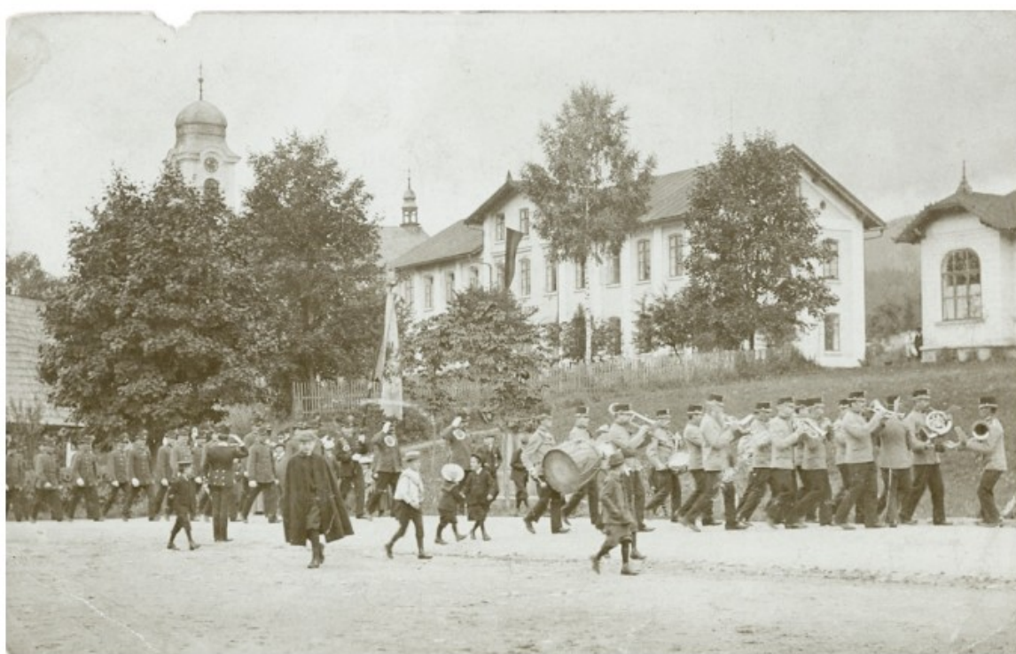
Nová škola při oslavě císařových narozenin 1910

veteránů (Veteranverein Harrachsdorf). V téže roce byl založen též dobročinný spolek Krakonoš (Rübezahl). Spolek organizoval charitativní akce, koncerty, kulturní vystoupení a z výtěžku přispíval na chudé, na školu a z jeho peněz byl financován i kamenný kříž na památku padlým v první světové válce. O deset let později byl založen místní spolek turnerů, Neuwelter Turnverein. Ve své době nejvýznamnější harrachovský spolek měl pestrou činnost. Zasloužil se o výstavbu tělocvičny (dnes kino) v roce 1900 a cvičiště (nohejbalové kurty) v roce 1923. V rámci turnerů vystupoval i místní divadelní a pěvecký spolek. V roce 1873 koupila obec v blízkosti kostela od Franze Schiera pozemek na výstavbu nové školní budovy. 21. dubna 1873 se konalo slavnostní položení základního kamene. Stavba trvala dva roky a 17. října 1875 byla nová škola farářem Karlem Nickelem vysvěcena. Do školy se přestěhovaly děti ze všech škol Harrachova a Nového Světa.