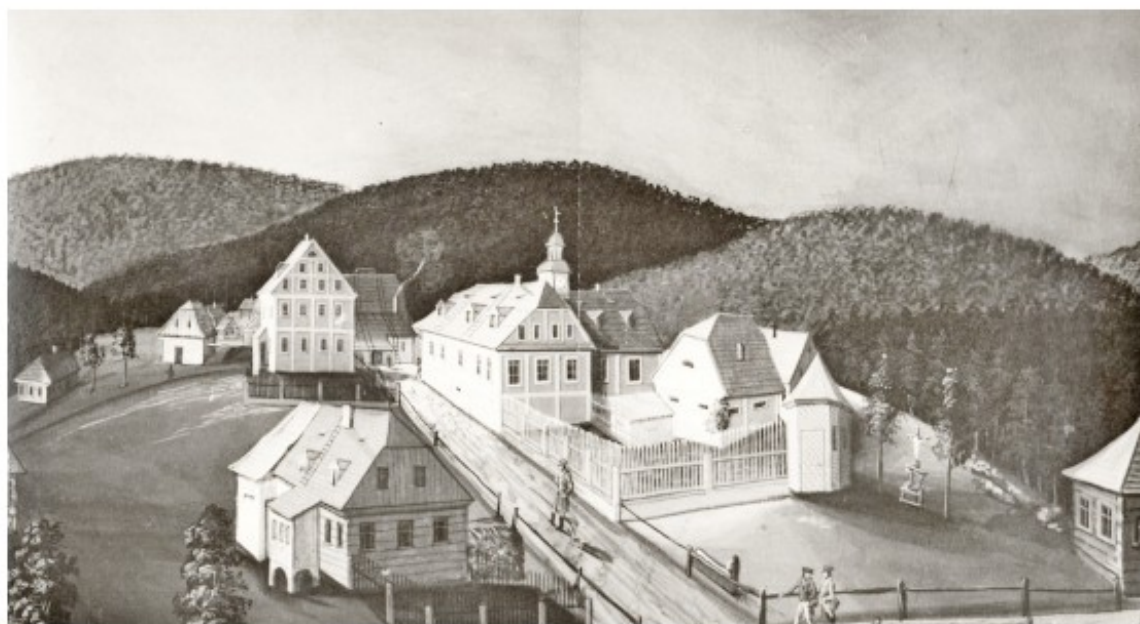
Harrachovská sklárna kolem roku 1800