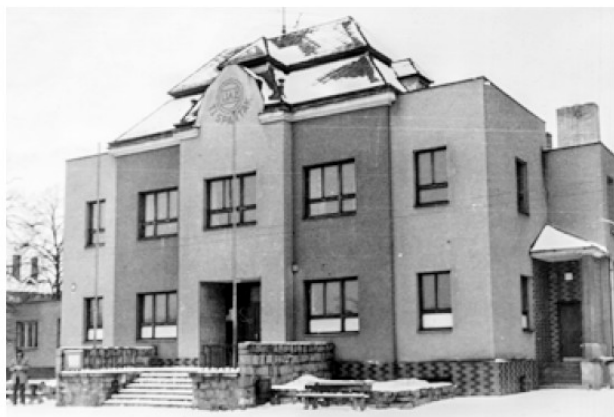
Během přestavby v 70. letech sokolovna přišla o zdobné prvky.