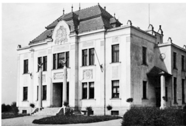
Původní zdobnou fasádu měla sokolovna více než půl století.