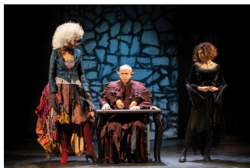
Divadlo Studio DVA adaptace filmové komedie Saxana