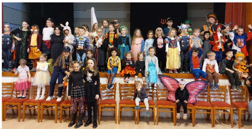
Dětský maškarní bál