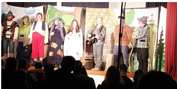
Divadelní spolek Markvart pohádka Liný Kuba, holé neštěstí

Díky Mladějovské Formance jsme měli možnost zhlédnout v divadelní sezóně 2022 představení: Slavíci z Markvartic; Tak nějak světáci; Hrdý buď, žes...; Revizor. V únoru 2023 zakončila divadelní sezónu povedená divadelní pohádka Liný Kuba, holé neštěstí, kterou k nám přijel zahrát Divadelní spolek Markvart. Nadále se můžeme těšit na podzimní sezónu, kdy budeme moci zhlédnout opět zajímavé divadelní hry v provedení ochotnických divadel. Pro vyplnění čekání na nové divadelní představení Obec Mladějov pořádá jarní zájezd do Divadla Radka Brzobohatého na hru Drahoušku, toužím po tobě a po letních prázdninách je plánována divadelní adaptace filmové komedie Saxana v pražském divadle Studio DVA.